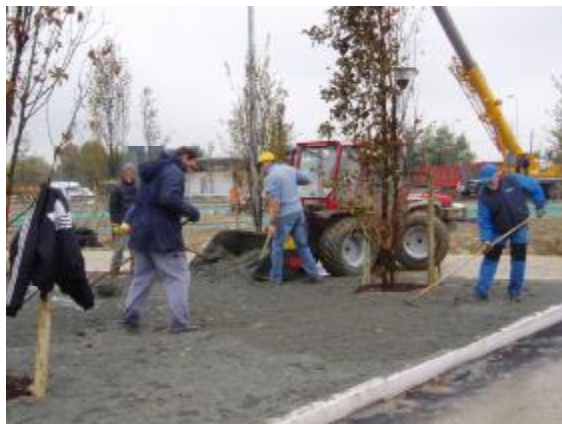
Stesura e livellamento sabbia