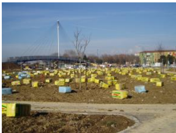
Distribuzione balle torbe, apertura, distribuzione, erpicatura, fresatura e semina